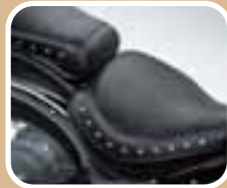
Cruiser in Bestform: Sitzbank mit Nieten