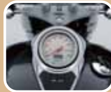
Stilecht: Soloinstrument auf Tropfentank

Highway-Feeling vom Feinsten – stilecht in coolem Anthrazit mit nietenverzierter Sitzbank. Dazu kommen die Qualitäten eines echten Cruisers, z.B. die klassische Starrahmen-Optik oder der drehmomentstärkste V-Twin, der je bei einer 800er SUZUKI für Durchzug sorgte. Zeigen Sie anderen Cruisern, was Sache ist – mit dem Editionsmodell Intruder 800Z Volusia.