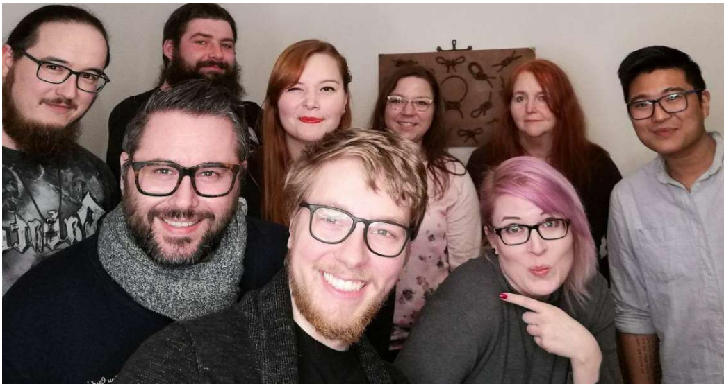
Ein Teil des Teams im Januar 2020